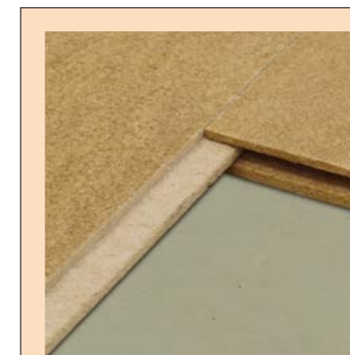
Finition mortaise et tenant